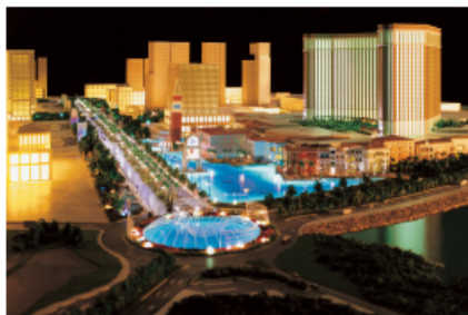
第十二屆澳門國際貿易投資展覽會將於澳門威尼斯人會議展覽中心舉行

在貿促局與多家國際會展集團簽署夥伴展會的帶動下，MIF 將透過是項合作取得更多市場資訊及客源，藉此邀得更多投資者、企業家及專業買家參會，MIF 的成效將得到進一步提昇。