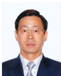
消防局 馬耀榮局長

http://www.madeinmacau.net E-mail: aim@macau.ctm.net