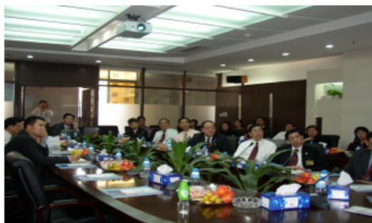
聽取行政服務中心官員講解佛山概況