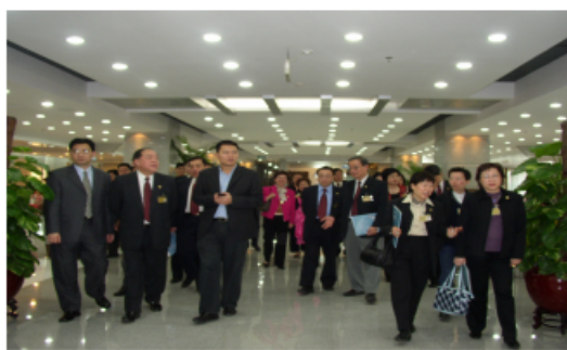
參觀行政服務中心