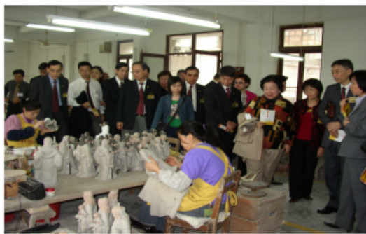
參觀佛山石灣美術陶瓷廠