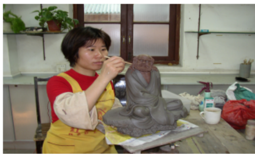
工人細心雕琢陶瓷人物型態