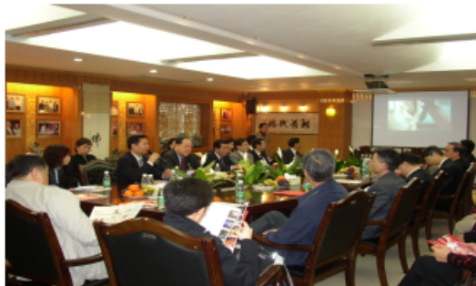
與內地紡織企業進行交流